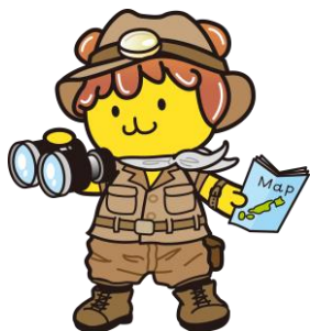
「秩父Things to do」