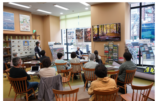
※画像はイメージです

トークセッション後は、登壇者に直接質問や相談ができる時間を 設けています。この機会に色々とお話ししてみてください。