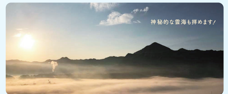
神秘的な雲海も拝めます！

世界保健機関(WHO)が推奨する国際認証制度である、セーフコミュニティ認証取得！ 地域住民も参加して「世界基準の安心・安全なまちづくり」に取り組んでいます。