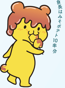
身長はみそポテト10串分

秩父市のイメージキャラクター「ポテくまくん」。秩父名物のB級グルメ、「みそポテト」が大好きなくまの妖精です。キュートな姿は、多くの人から愛されています。