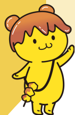
秩父市 ポテくまくん

埼玉県で自然が豊かな「寄居町」 「秩父市」「小川町」は、特急利用 で池袋駅まで約60分～90分。都心 へのアクセスも良く、引っ越し感 覚で移住することも可能です。